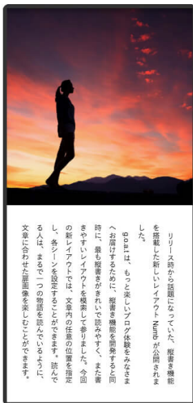
▲スマホ版表示画面例